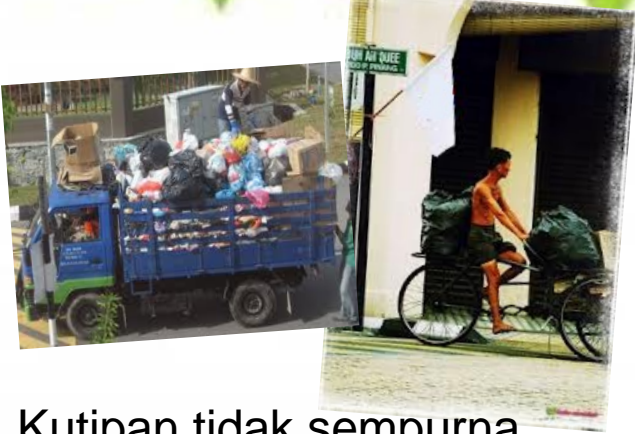
Kutipan tidak sempurna