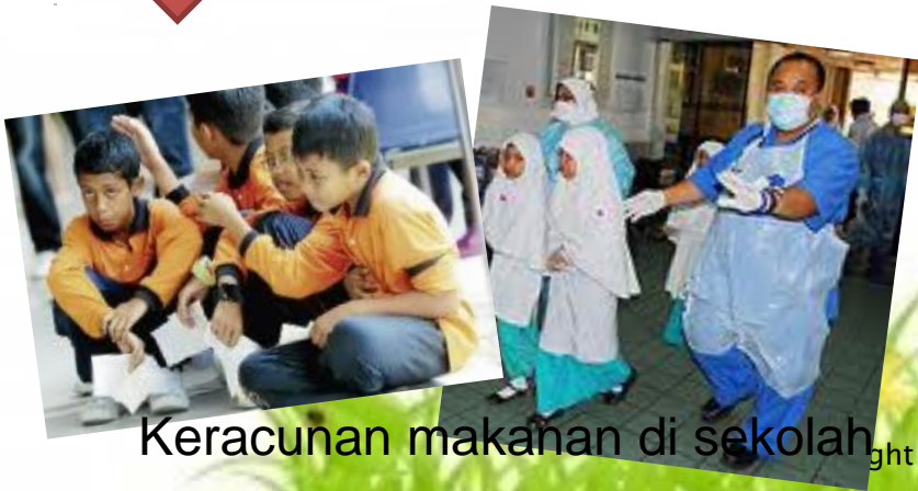
Keracunan makanan di sekolah