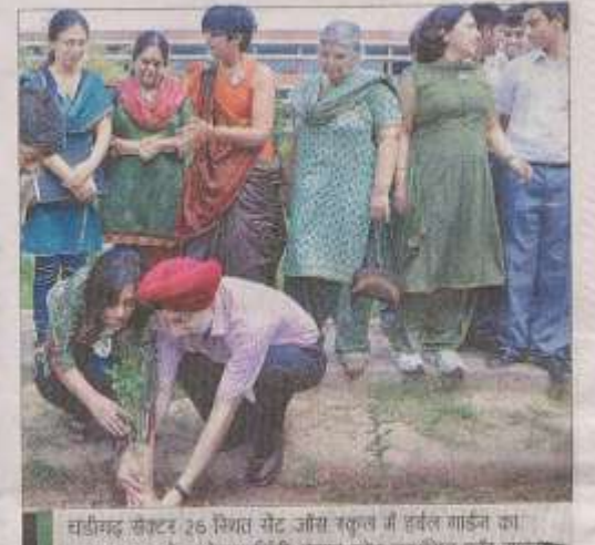
चडीगढ़ संकटर 26 निमत सेंट जीस बकुल में हर्वल मार्डन का वर्व्याटन करते बारडेडायधीनीटी, पंजाब स्टेंट कार्डानेल कॉर साइनाइन एंड देवनोताजी के ज्याबट अवस्थाटर डॉ. गतनाम सिंह।

संस्था को उपाध्यक्ष गामनी खुरी ने बताया कि इस अधियान के तहत पीधों को अगिनक तरीक से उपाने के लिए बच्चों को प्रीरत करेंगे। इस गार्डन में मीडिसनल पीधे भी उसाएंगे जिनसे दलाएं बनाई वा सकती है। आने बाले समय में