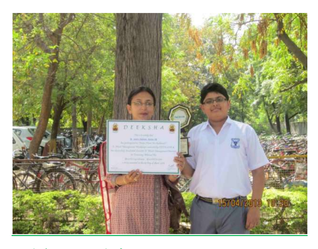
St John's won a trophy for E Waste management